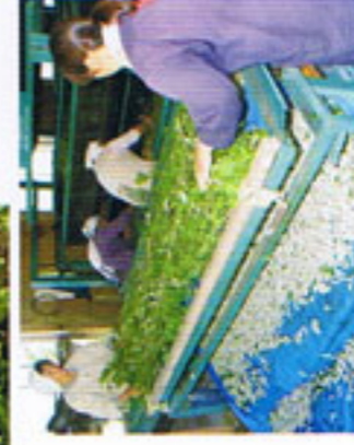
厳選した素材から上質の生糸が生まれます