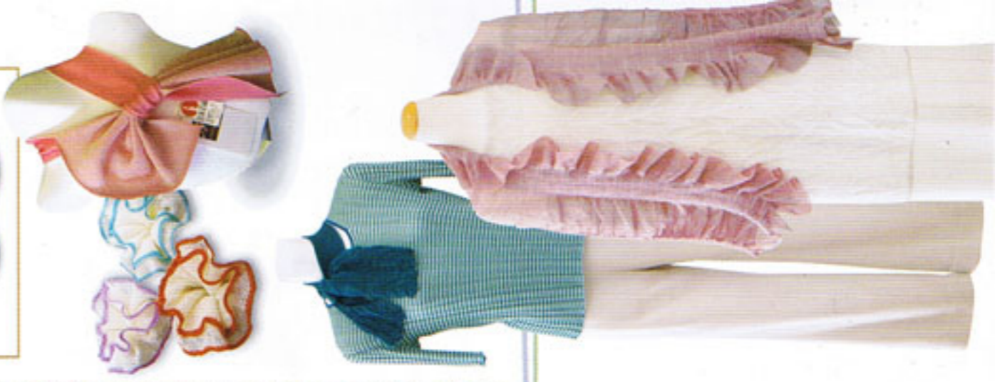
上質のシルクの魅力を余すことなく引き出した製品の数々

「ぐんまシルク」認定 群馬県では、オリジナル蚕品種の生糸・絹製品の生産と販売促進及びブランド化を図るため、「ぐんまシルク」認定委員会により審査し、認定シールを発行。